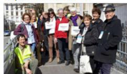
Les participants au "RallyerBrié" étaient attendus place de Verdun, à l'Ancien Musée de peinture.

« Il est temps de se déplacer autrement » 12/03/17